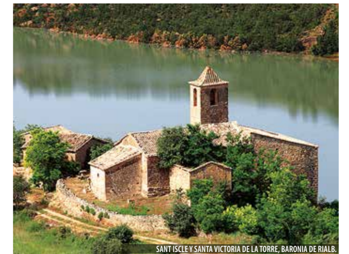
SANT ISCLE Y SANTA VICTORIA DE LA TORRE, BARONIA DE RIALB.