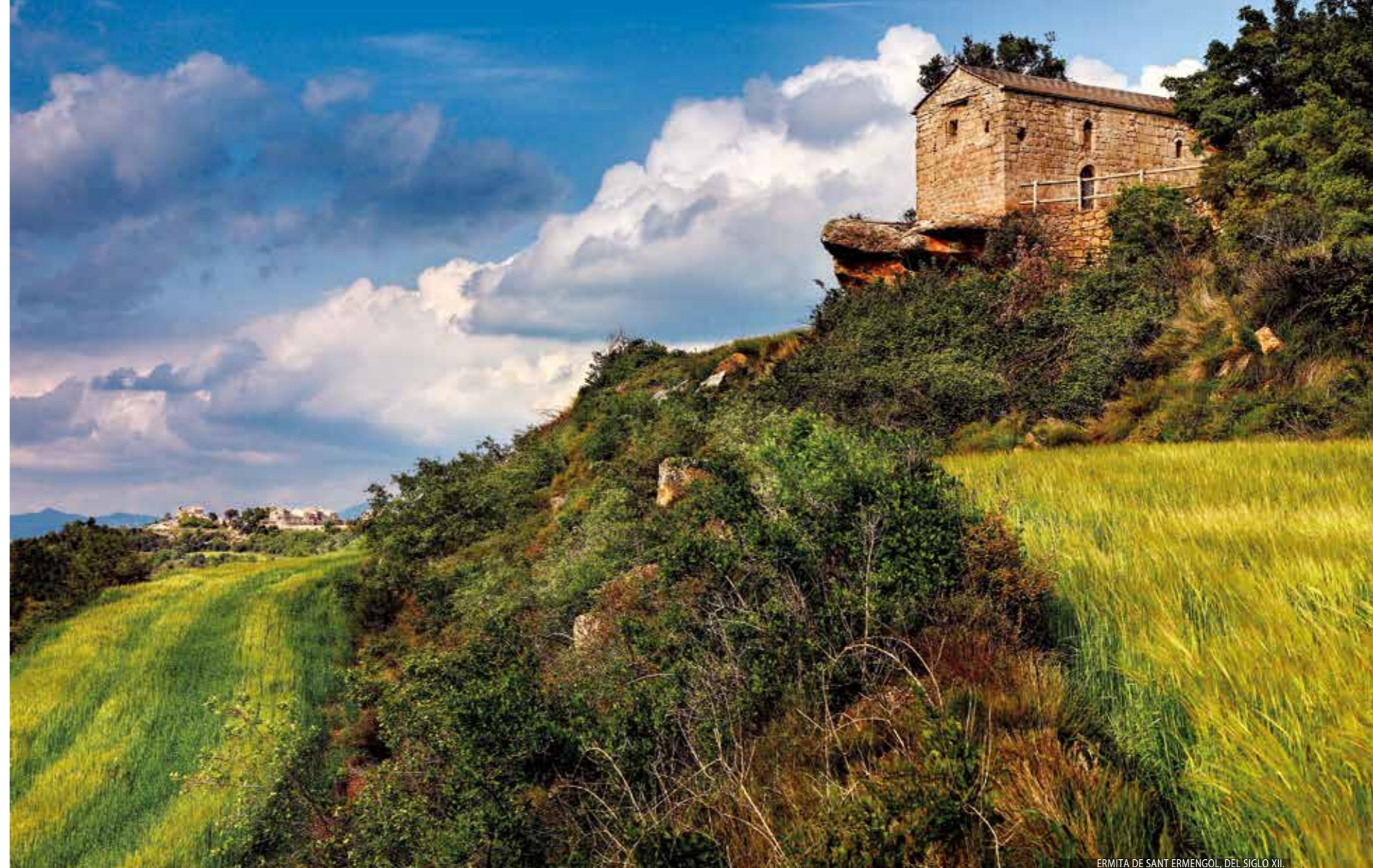
ERMITA DE SANT ERMENGOL, DEL SIGLO XII.