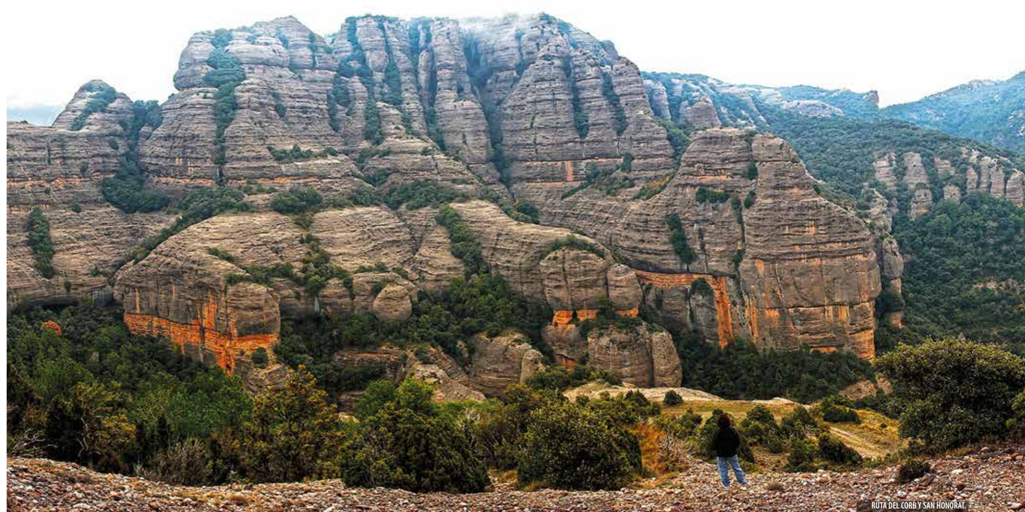
RUTA DEL CORB Y SAN HONORAT.

El embalse de Rialb, a los pies de Tiurana, es el segundo más grande de Catalunya. Pocos kilómetros más arriba está el pantano de Oliana.