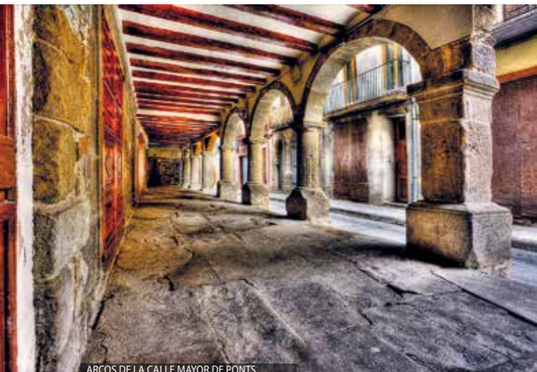
ARCOS DE LA CALLE MAYOR DE PONTS.